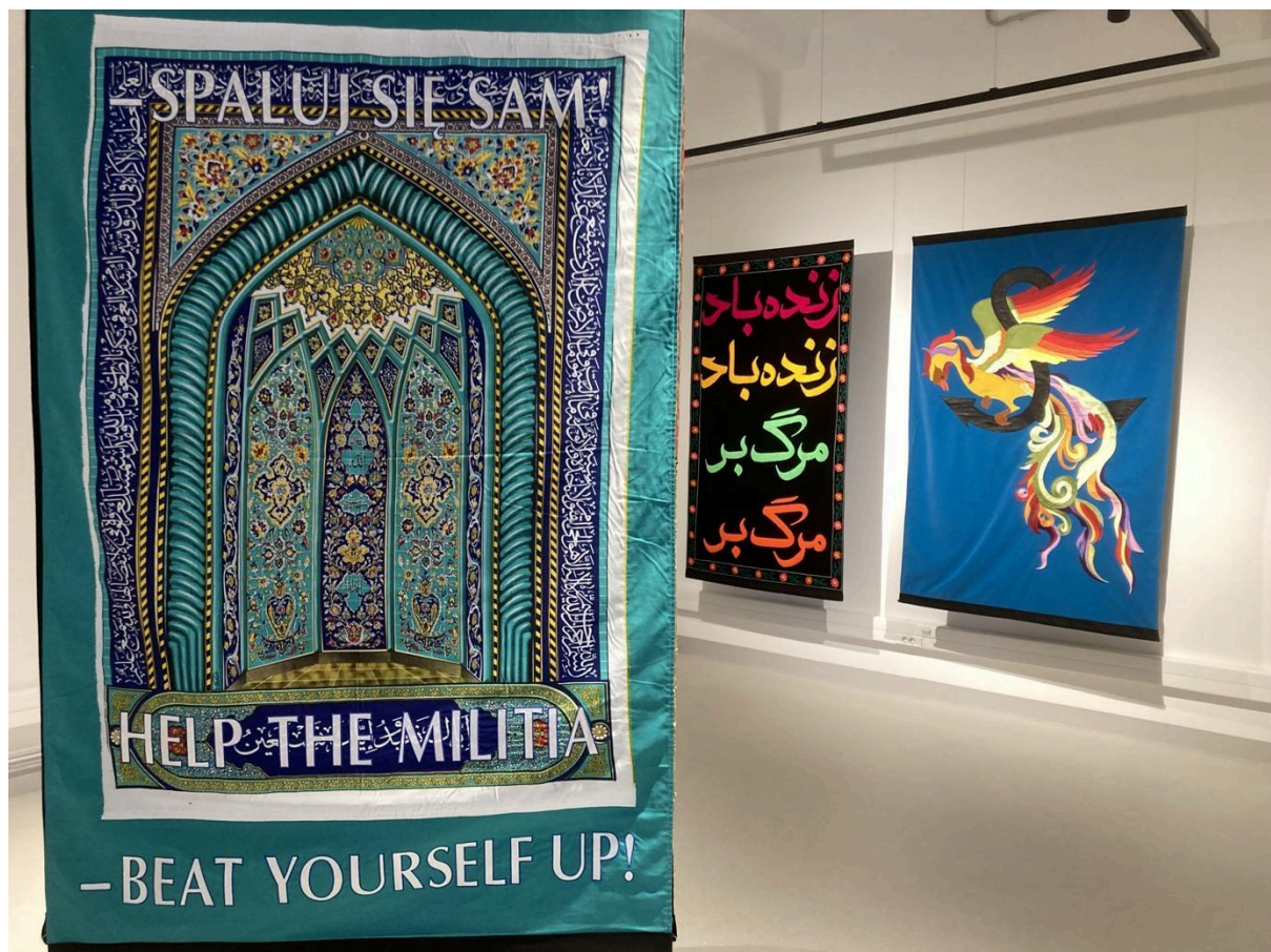
Slavs and Tatars: Népek barátsága

Amit láttam a kiállításból, az érdekfeszítő és elgondolkodtató volt. Ráadásul még érthető is, pedig azt gondoltam, hogy itt olyan progresszívek a művészek, hogy az nekem már túl bonyolult lesz. De nem. Amikor pedig elakadtam valamivel, akkor a magyarázó szövegek segítettek. Bevallom, sok kiállításon úgy érzem, hogy a magyarázó szövegekhez is kellene nekem magyarázat, pedig szövegértésből mindig kiemelkedő teljesítményt nyújtottam középiskolai tanulmányaim során.