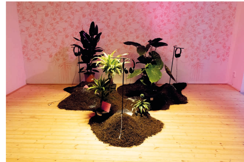
Mai Ling: Dirt Nouveau , kiállítási enteriőr, Kisterem, fotó: Dobos Flóra © OFF-Biennále Budapest Archivum / HUNGART © 2025

Az OFF céljai között szerepel, hogy magyar művészek – akik a támogatott szabad alkotás lehetőségétől már szinte teljesen elszoktak – új műveket hozhassanak létre. Az OFF-on kívüli időkben szegényessé váltak a bemutatkozási lehetőségek, így már az is nehezen megkülönböztethető, mi az új, ami csak így jöhetett létre, és mi az, amit már korábban is láthattunk volna, de az intézményi