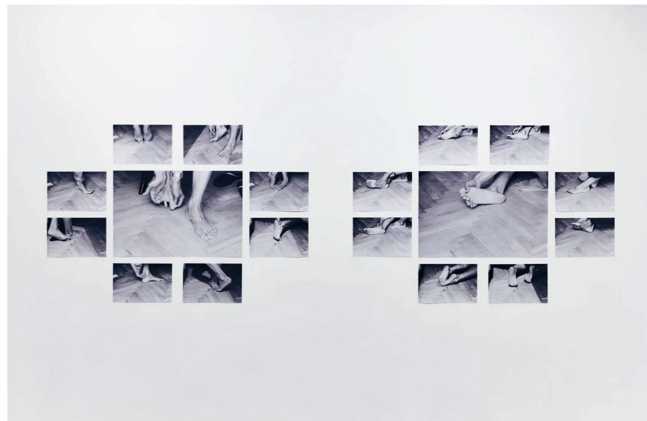
Anna Daučíková: My Feet I. és II. (Lábaim I. és II.) , 1993–1994, fekete-fehér fénykép, 10 × 15 cm (16 db), 40 × 30 cm (2 db), Trafó Galéria