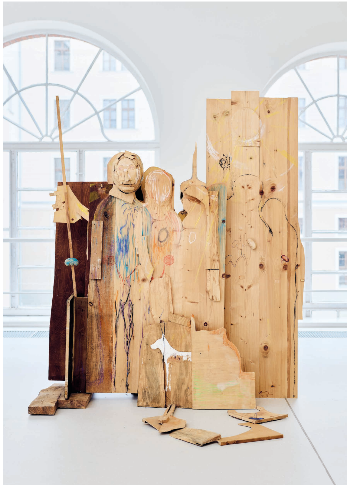
El-Hassan Róza: How to proceed (human collective) (Hogyan kell eljárni? [emberi kollektíva]), 2017, fa, vegyes technika, 170 × 200 × 175 cm, Merlin, fotó: Biró Dávid © OFF-Biennále Budapest Archívum / HUNGART © 2025