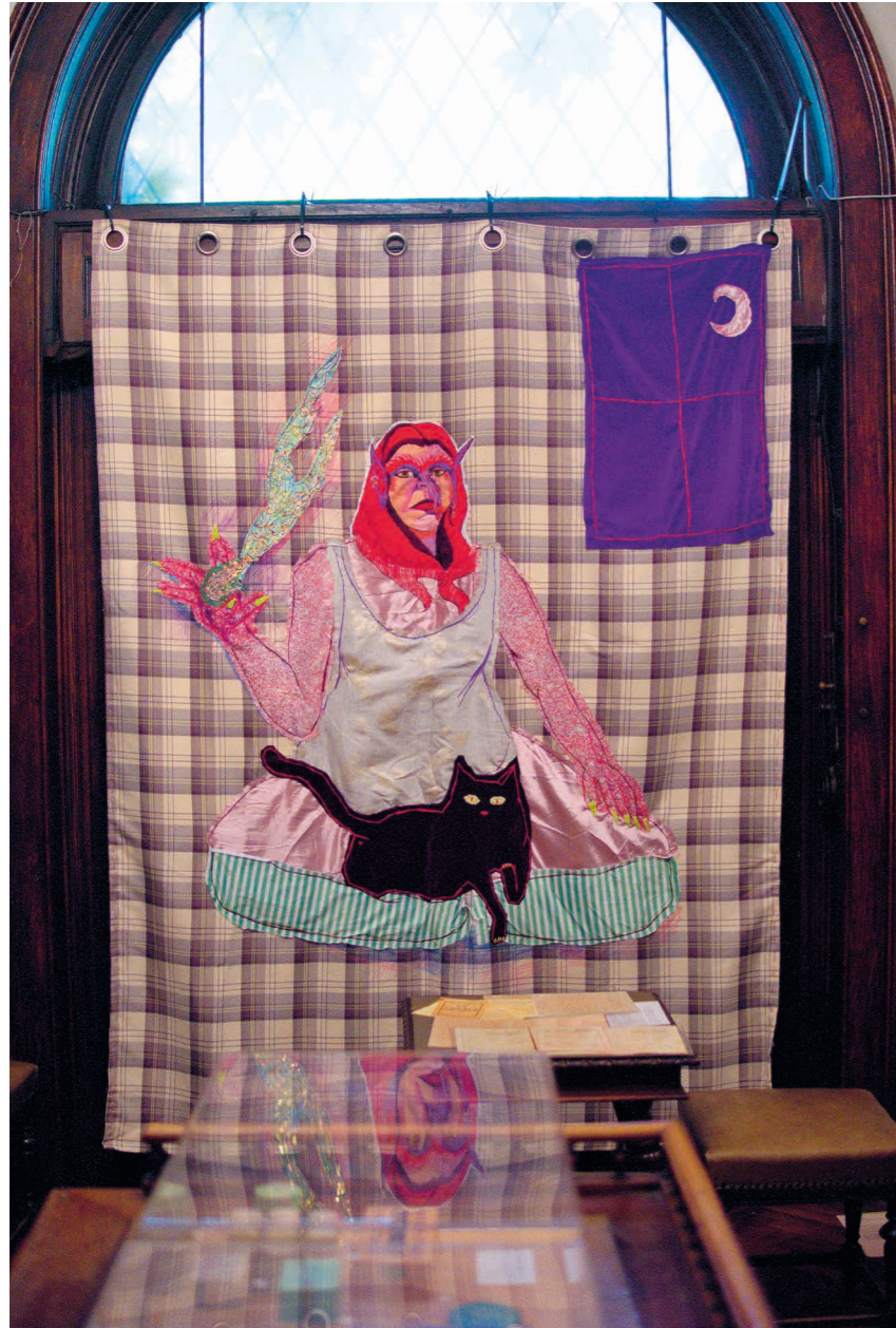
Kiállítási enteriőr, Holnapután minden megváltozik , Dankó Boglárka: Mainstream Mythology III , 2024, vászon, vegyes technika, 230 x 160 cm, Ernyey József Gyógyszerésztörténeli Könyvtár – SOM, fotó: Nyári Kristóf © OFF-Biennále Budapest Archivum / HUNGART © 2025

A helyszínek is átalakultak. 2015-ben 100 helyszínen csaknem 200 esemény zajlott le, most 15 kisebb-nagyobb térben vagy intézményben valamivel több, mint 40. Nemcsak a számok jelzik a változást, vagy az, hogy egyes budapesti önkormányzatok is partnerré váltak, hanem az eltelt idővel mintha a független terekbe is beleíródott volna már az a keserves intézménytörténet, amely a magyar kultúrának, ezen belül a kortárs képzőművészetnek is kijuttott. Ritkán idézzük fel magunkban, de egy-egy pillanatban pengeélen táncolt, hogy például a Liget Galéria