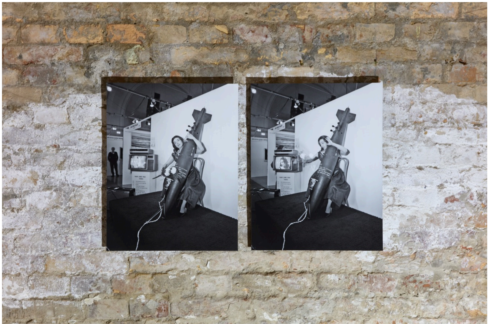
Cal KOWAL Charlotte Moorman a Csellóbombával a Chicagói Művészeti Vásáron 1984-ben, 1984 Kiállítási nyomat: giclée nyomat, dibondra kasirozva

A brosúrát a kiállításához fordítottuk magyarra, ezzel is közelebb hozva a látogatókhoz. Szinte azonnal feljött az az ötlet, hogy egy bunkert keressünk. Eleinte különböző más helyeken nézelődtünk, de hamar kiderült, hogy nemrég nyílt meg a Bakáts Bunker. Gyorsan lecsaptunk rá, nyitottak voltak az együttműködésre, nagyon jó partnerség alakult ki.