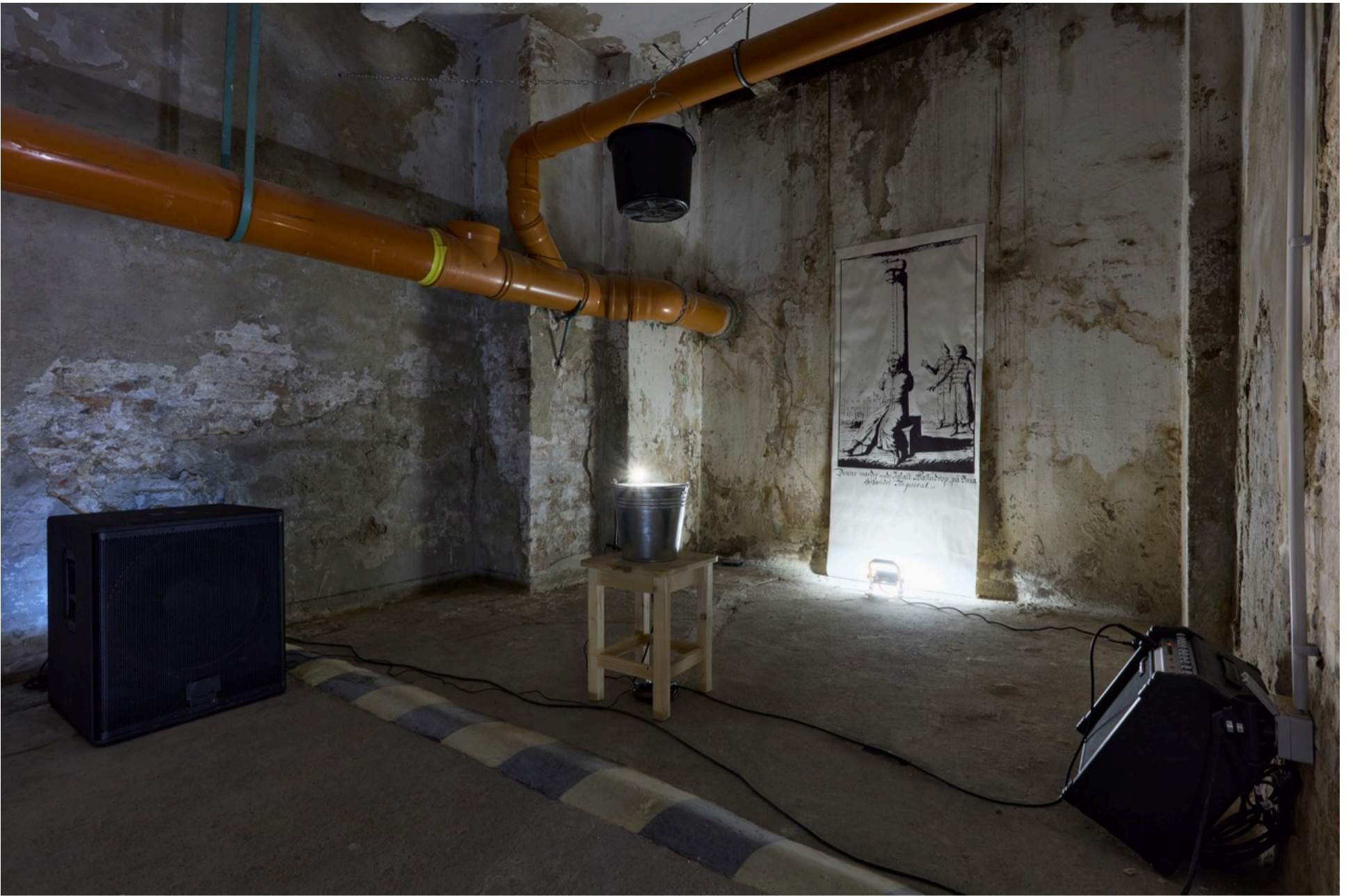
JENESES Ádám, KOPHELYI Dániel, KRASZ Ádám APO-WIND, 2025 Mixed media installáció A művészek jóvoltából A művek az OFF-Biennále 2025 megbízásából jöttek létre.