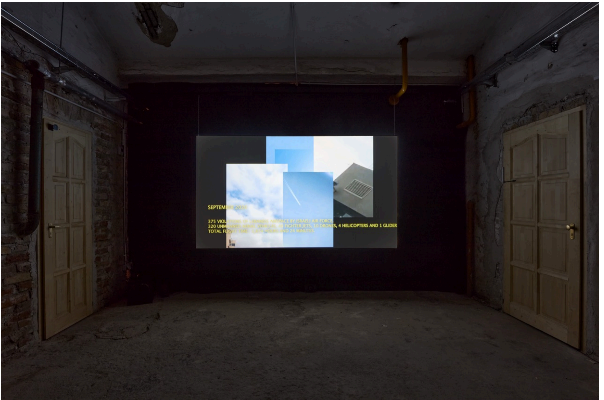
Lawrence ABU HAMDAN Egy égbolt naplója, 2024 Videó, 44'32" A művész jóvoltából Fotokredit: Biró Dávid copyright: OFF-Biennále Budapest Archivum