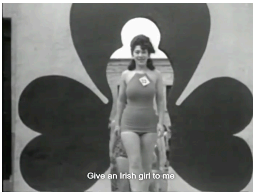
Mother Ireland, részlet, © Derry Film and Video Workshop

Idén az OFF-Biennále fő témája a biztonság , ezt vizsgálja az Ezek a falak nem minket védnek című kiállítás is, ahol a munkások szerepel. A koncepciót eredetileg a 39. EVA International vendégprogramjaként, a Little did they know projekten belül született meg, mely esemény kulcsfogalma a bizonytalanság volt. A biztonság és a bizonytalanság antonimiái mentén a kiállítások mégis hasonlóan fontos problémákat emeltek témává. Hogyan látod a munkásokat ebben a kontextusban?