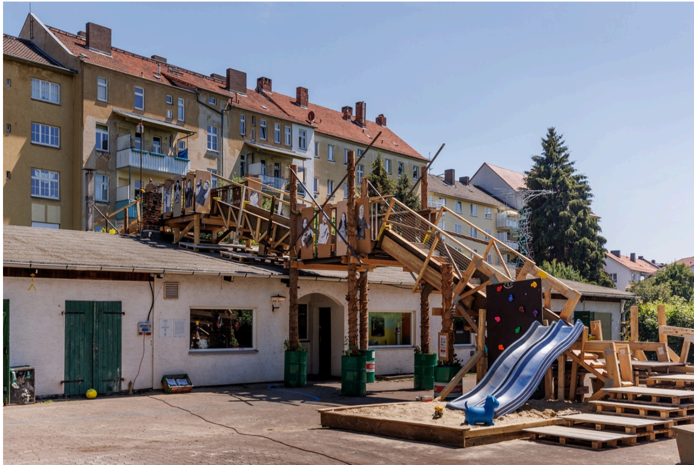
Recetas Urbanas: Jumping in Hanoi (The Everything Bridge), documenta fifteen, Ahoi Boathouse, Kassel, 2022, photo: Frank Sperling

E.N.: A köztéren különösen élesen vetődik fel a biztonság kérdése: ami valakinek a biztonságot jelenti, az másnak korlátozást, nagyon sok különböző szempont kerül itt szembe egymással. A kerítések és tiltótáblák jelentenek a biztonságot? Vagy az, ha megtanulunk együtt lenni, akár közösségalkotás nélkül is? Az építmény távolról asszociál a házra, ami kapcsolódik a biztonsághoz, ugyanakkor kevesebb határt jelöl ki. Falai nincsenek, átjárható, invitáló, így azt kommunikálja, hogy a biztonság nem feltétlenül az elzárkózásban található meg.