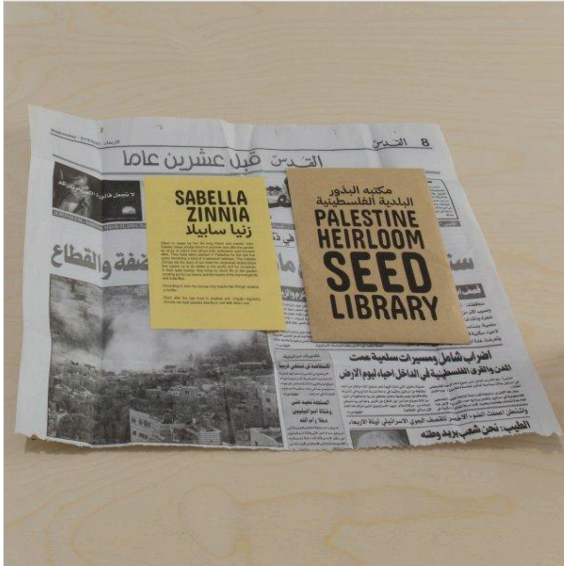
Palesztin örökség mag könyvtár