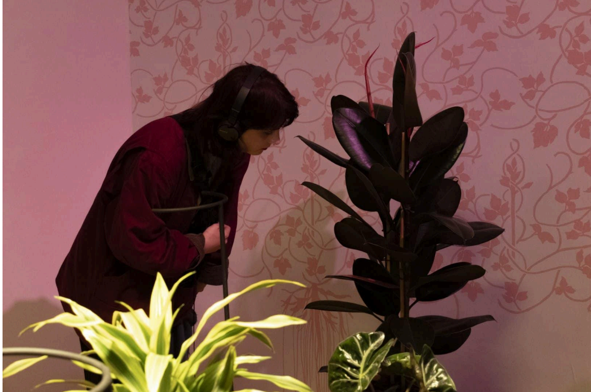
Mai Ling: Dirt Nouveau