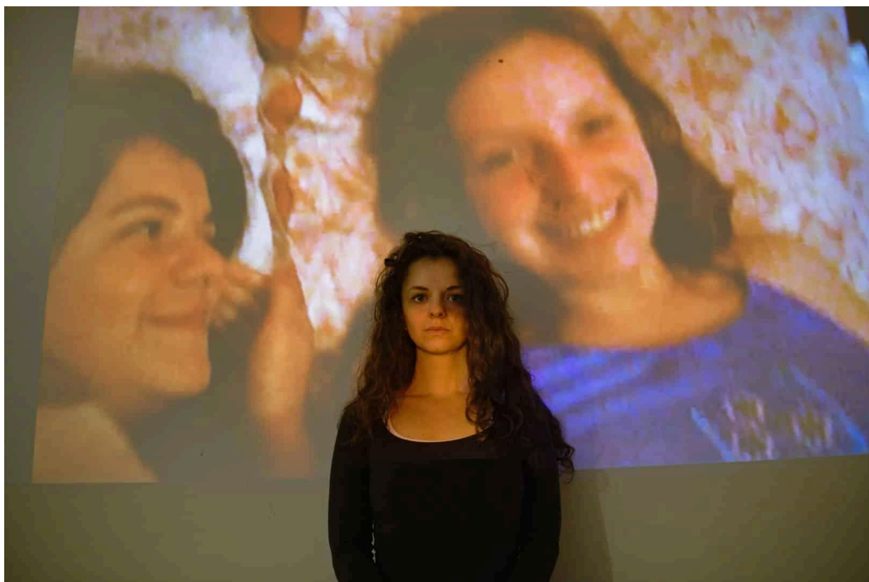
Bede Kincső: Pista művészete

A térben tovább haladva teljeseedik ki a fotósorozaton már feltűnő gyapjú motívuma a falra applikált kesztyűk és zoknik formájában. Ezek a puha, kötött textíliák a nagymama repetitív, kényszeres pótcselekvésének produktumai, melyek egyszerre hordozzák a gondoskodás és a feldolgozhatatlan veszteség érzéseit. Ez a narratíva különös hangsúlyt kap az egykori fürdőszobába helyezett monumentális fotónagyításban, amely a nagymama visszeres lábát mutatja. A felnagyított részlet vizuális metaforaként van jelen: a bőr felszínén kirajzolódó erek térképe magában hordozza mindazt a bánatot, elhagyatottságot és megbántottságot, amit a személy képtelen vokalizálni.