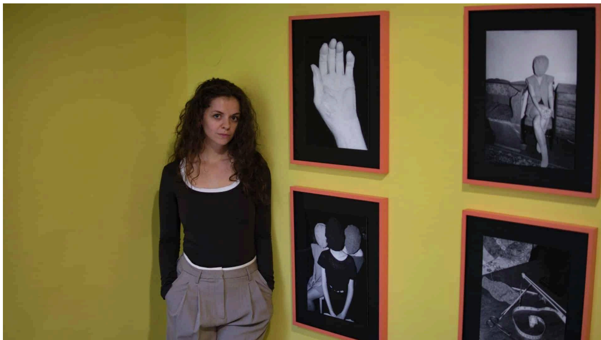
Bede Kincső: Pista művészete

Szerző: Ferencz Kincső Anna - 2025. május 27.