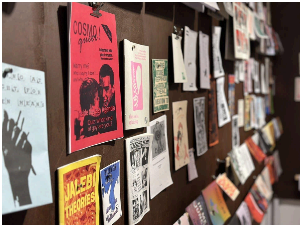
Zin library