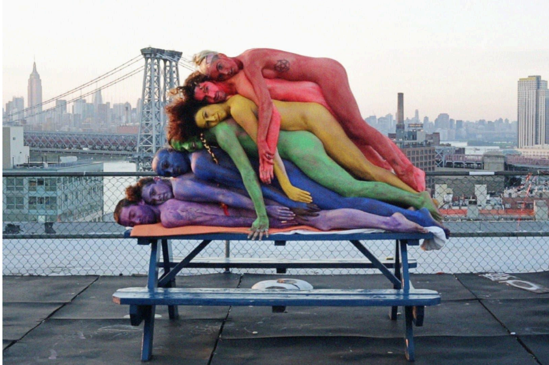
Melanie Bonajo: Night Soil –Nocturnal Gardening, 2016 (c) Melanie Bonajo