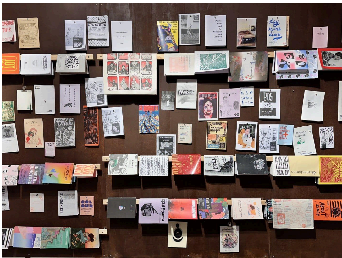
Zin library

sokoldalúan használható rendezvényhelyiségre is, ahol például installációkat lehet bemutatni vagy performanszokat lehet tartani. Azt is észrevettük, hogy jelenleg nincs olyan helyszín Budapesten, ami kifejezetten a videóművészetre koncentrálna. Ezért teret adunk ennek a műfajnak. Személyes motiváció is vezérelt: kurátorként sokszor tapasztaltam, hogy hosszabb, egy-másfél órás videoalapú alkotásokat egyszerűen loopban vetítenek kiállítóterek falára, holott ezeket mozi terem hangulatban kellene megnézni. Ezért mi dedikált vetítéseken mutatjuk be az ilyen hosszabb videókat, vagy rövidfilmeket. Ez koncentráltabb megtekintést tesz lehetővé, és befogadhatóvá tesz nagyobb lélegzetvételű, narratívabb munkákat.