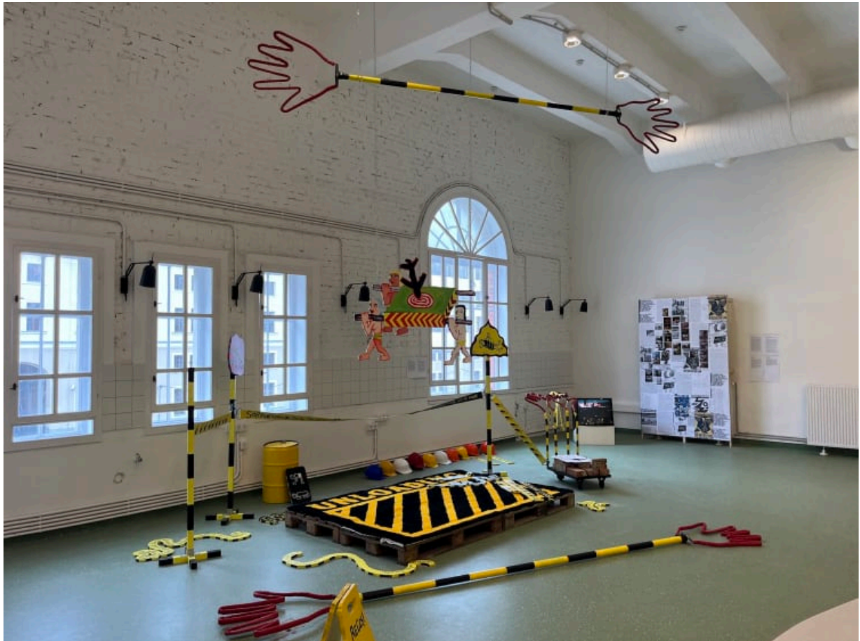
Részlet a kiállításból

( https://www.artisbusiness.hu/uploads/images_2025/3142/off_reszlet_.jpg )