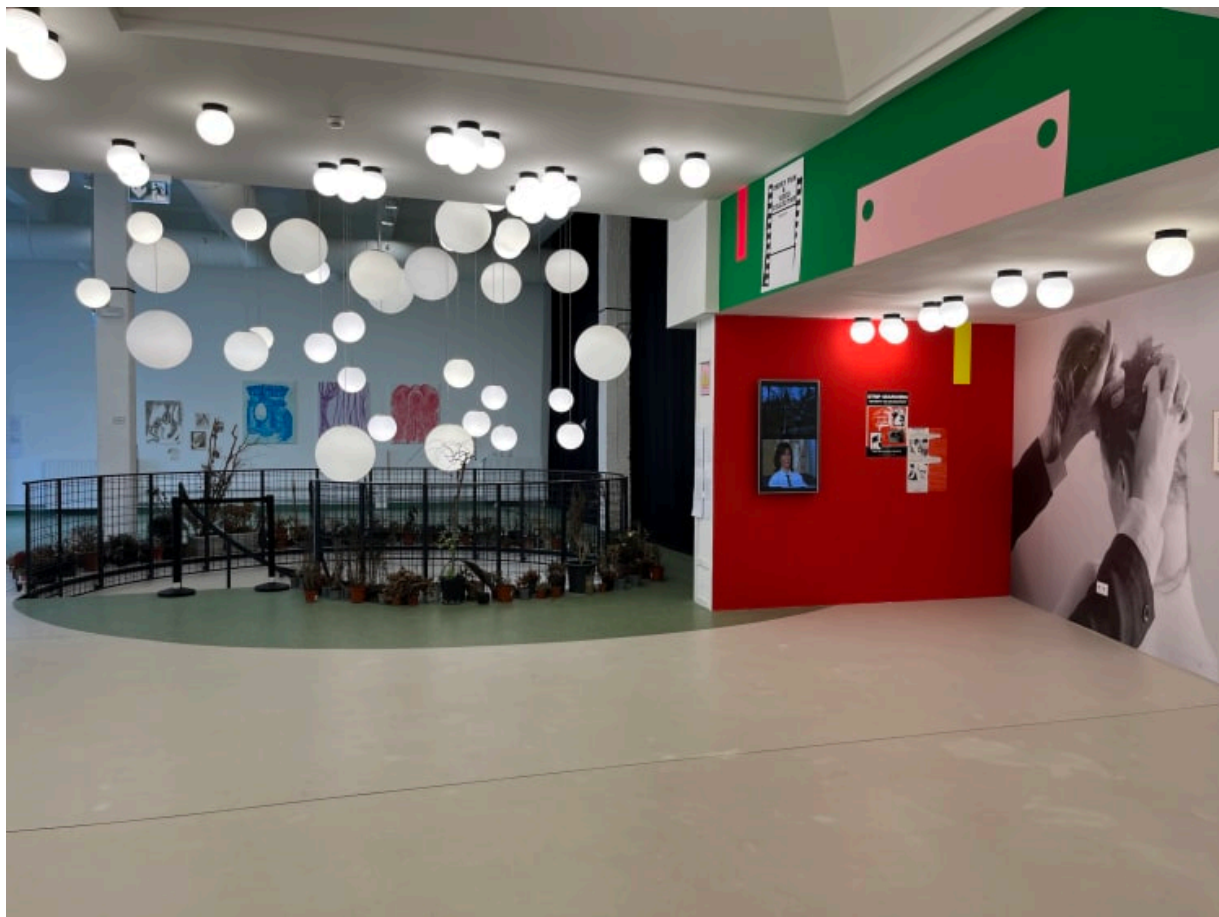
DERRY FILM &amp; Video Collective installációja: PRESENT

( https://www.artisbusiness.hu/uploads/images_2025/3142/kiallitas_reszlet_off.jpg )