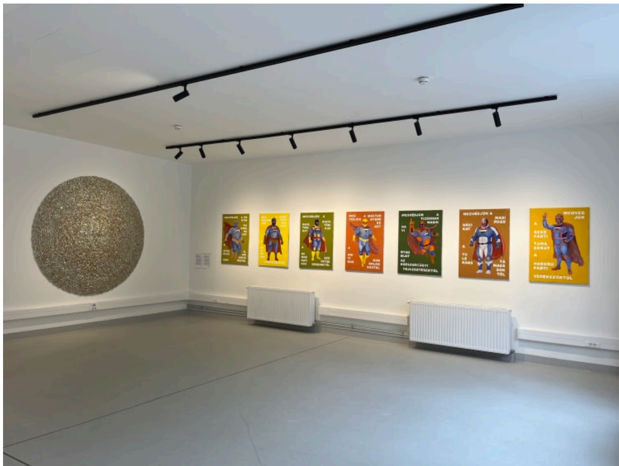
Részlet a kiállításból

( https://www.artisbusiness.hu/uploads/images_2025/3142/reszlet_off.jpg )