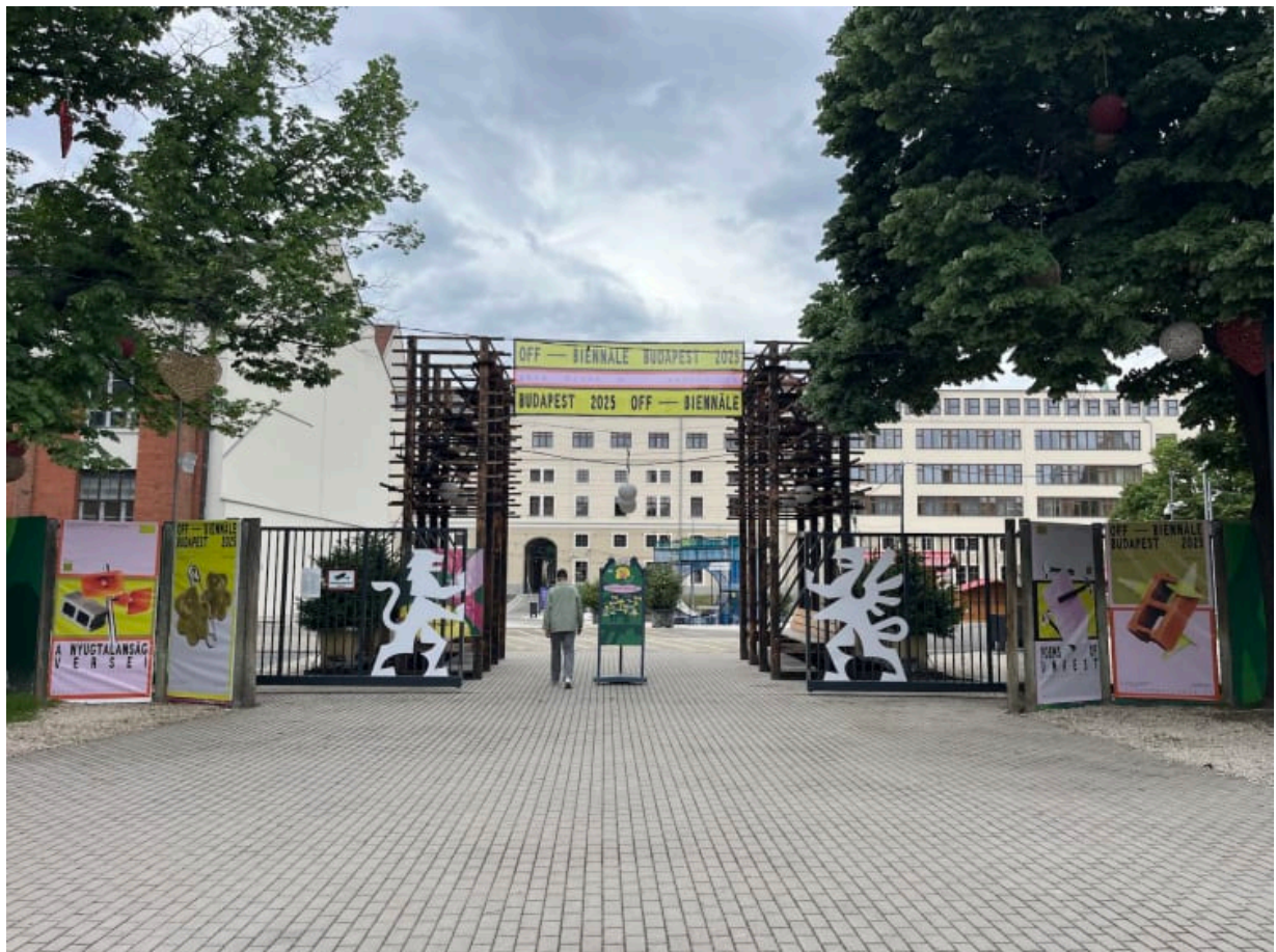
Az OFF-Biennále bejárata

Teljes mértékben. Persze sokszor elcsúszik a kommunikáció: mit nevezünk egyáltalán politikai kiállásnak? Mi nem pártpolitikai értelemben gondolunk erre, tehát nem a szűk értelemben vett politizálásról van szó, hanem arról, hogy valaki közügyekről véleményt formál és e véleményt képviseli is: saját, vagy közössége hangján keresztül. Ebben az értelemben az OFF mindig is kiállítás volt. Saját jogon és a művészek hangját felerősítve is.