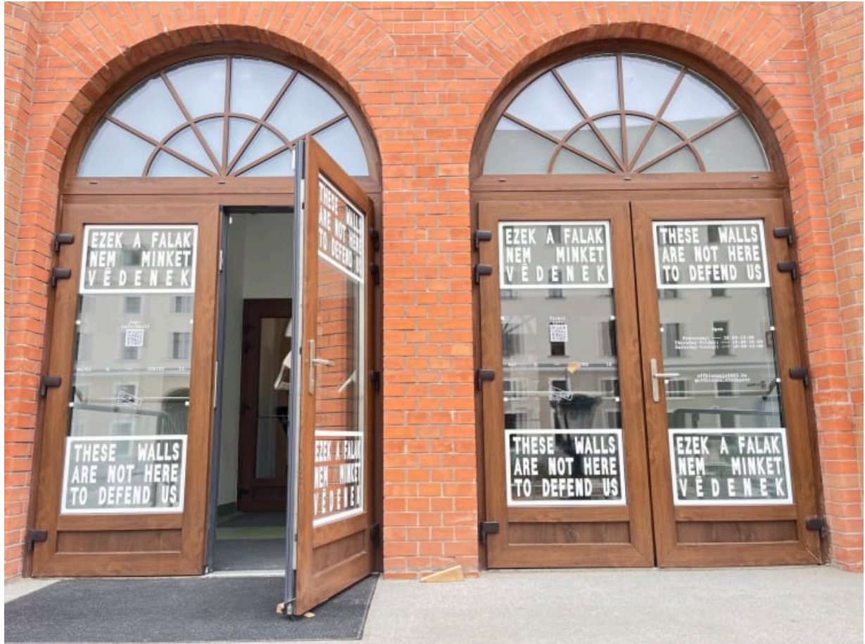
AZ OFF-Biennále bejárata a budapesti Merlinben

cégről van szó, az igazi cél az értelmes együttműködés. Az a legjobb, amikor a cégek nemcsak támogatók, hanem résztvevők is, és valóban hisznek abban, amit közösen csinálunk. A Praktiker például az egyik idei projektbe, a Kálvária téri „építkezős” installációba szállt be. A szlogenjük – „mindenki tud építeni” – pontosan összecseng azzal, amit a projekt állít: nem kell feltétlenül szakinak lenni ahhoz, hogy alkotóként vegyünk részt a világ formálásában. A Praktiker munkatársai el is jöttek építeni, videót forgatnak, tényleg beleálltak az élménybe. Azt látom, hogy Magyarországon ebben van potenciál: izgalmas módokon bevonni cégeket a független kultúrába. Persze ez hosszú folyamat. Idén viszonylag későn kezdtünk el céges szponzorációval foglalkozni, volt vállalat, amely a közeli határidő miatt nem vállalta az együttműködést, de felajánlotta, hogy beszéljünk a következő eseményről, mert abban szívesen részt vesz.